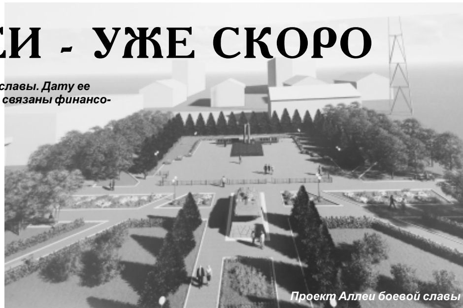
Проект Аллеи боевой славы

Впереди завершающий этап - в этом году необходимо закончить отделочные работы на стеле. Основание конструкции удалось возвести еще в прошлом году, тоже с участием спонсорской помощи. Сюда ушло около 190 кубометров бетона. Стела представляет собой вы-