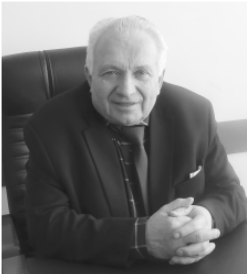
Развитие ТЭСЭР выходит на новые масштабы

- С какими результатами мы завершили 2019 год? В первую очередь, администрация масштабно трудилась над разработкой проектно-сметной документации на строительство важнейших объектов, необходимых для полноценной реализации программы ТЭСЭР "Линево". Напомню, что у нас определены две площадки под будущие производства. Первую, в районе бывшей лыжной базы, мы уже обеспечили электроэнергией на 500 киловатт, а также теплом, водой и канализацией. Сегодня там созданы все условия для того, чтобы первый резидент начал строительство производственных корпусов. Руководство ГК "Обувь России" обещает приступить к возведению фабрики в апреле-мае этого года. К слову, тех мощностей, которые заложены на первой инвестиционной площадке, достаточно, чтобы там начали работать сразу три резидента.